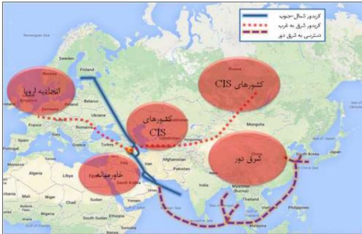
حوزه نفوذ غیر مستقیم خارجی